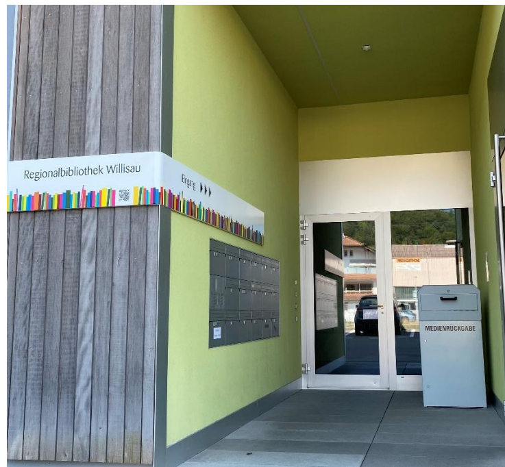
Unser neues Erscheinungsbild